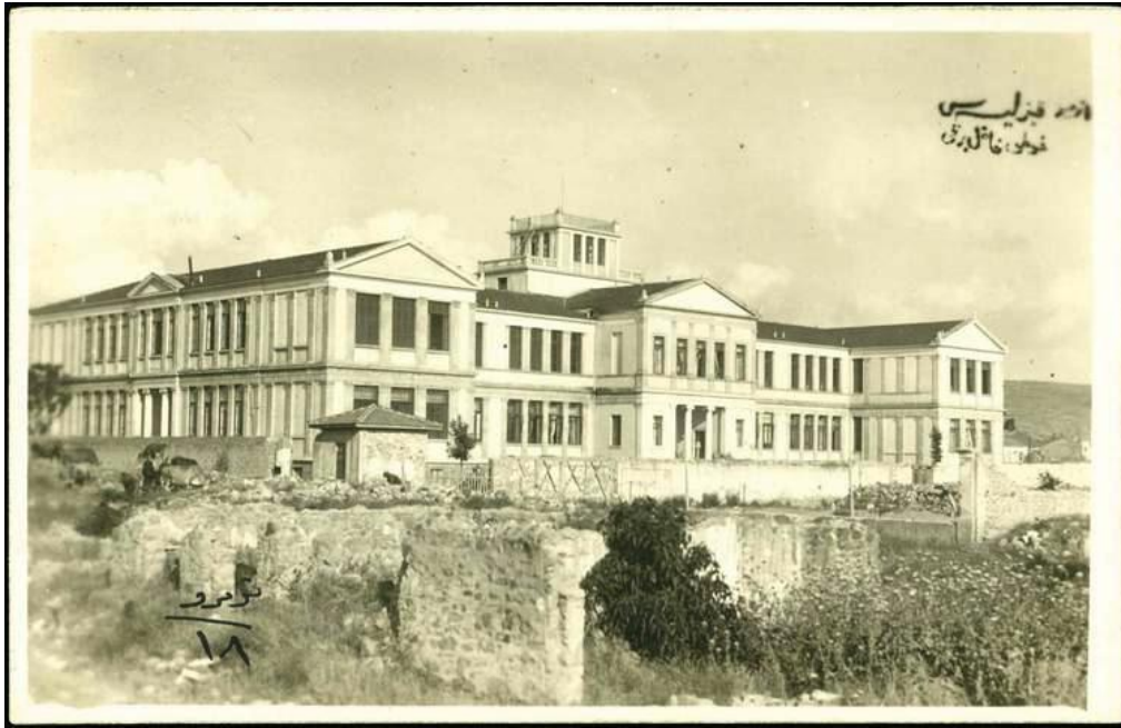
ΦΩΤΟ 2: Οι κτιριακές εγκαταστάσεις του ΙΠΣ