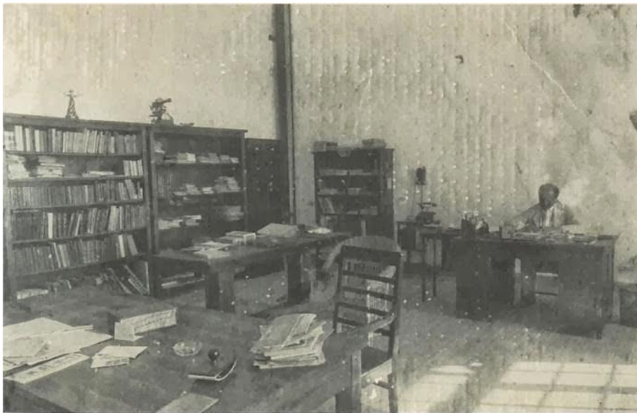
ΦΩΤΟ 3: Το γραφείο του Καραθεοδωρή στο πανεπιστήμιο Σμύρνης